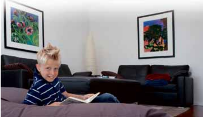
Persönliches Wohlfühlklima mit einem energiesparenden Flächenheiz- und Kühlsystem.

Flächen-Heiz- und Kühlsysteme haben viele Vorteile: Nutzerkomfort, architektonische Gestaltungsfreiheit, Energieeinsparung, gesundes Raumklima, Hygiene sowie Umweltschutz sind gute Argumente für diese Art der Raumtemperierung aus Wänden, Boden und Decke. Im Winter garantiert ein Niedertemperatur-Flächen-Heiz- und Kühlsystem wohlige, warme Raumtemperaturen, im Sommer sorgt es für angenehme Kühlung. Wirtschaftlichkeit, Wohlbefinden und bestmögliche Energieausnutzung werden durch eine raumweise Temperaturregelung garantiert. Schließlich hat jeder Wohnraum andere Anforderungen an die